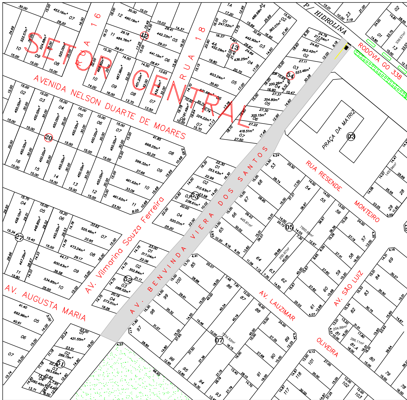
02 MAPA ILUMINADO - CENTRO SEM ESCALA